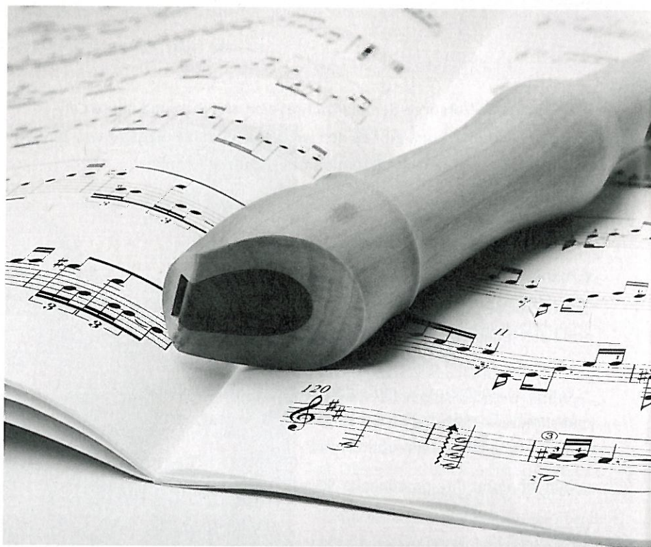
Wegen unmöglichen Arbeitsbedingungen legt eine Blockflötenlehrerin ihr Instrument zur Seite und sucht einen neuen Job.

Die dritten Klassen beginnen mit dem Frühenglischunterricht und die Schüler und Schülerinnen haben jeden Vormittag von 8 bis 12 Uhr Unterricht. Um die Arbeitssituation vom vorigen Jahr mit den Zwischenstunden zu vermeiden, versucht die Lehrerin, möglichst viele Lektionen auf die Nachmittage zu legen. Am Montagmorgen arbeitet sie von 8 bis 9 und von 11 bis 12 Uhr an der Schule. In der Zwischenzeit unterrichtet sie eine erwachsene